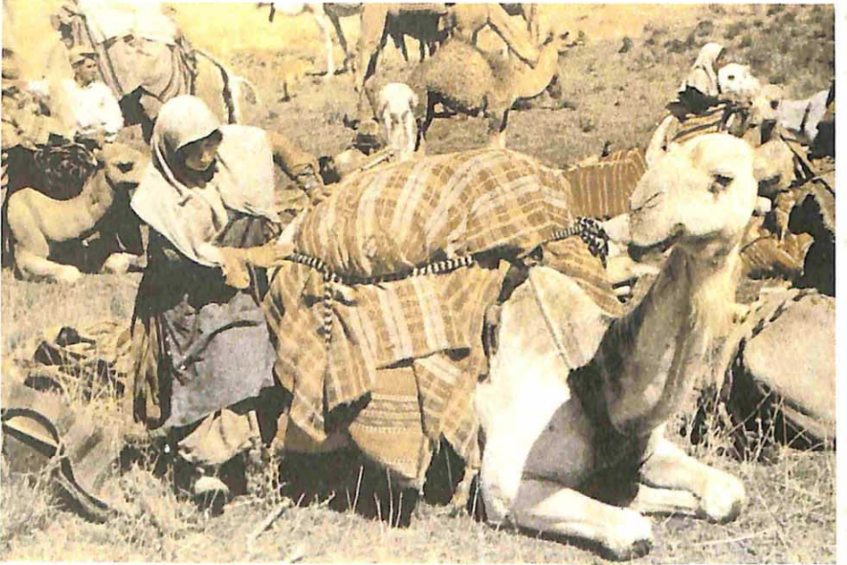
Akşaçların nezaretinde ilkbahar göçü